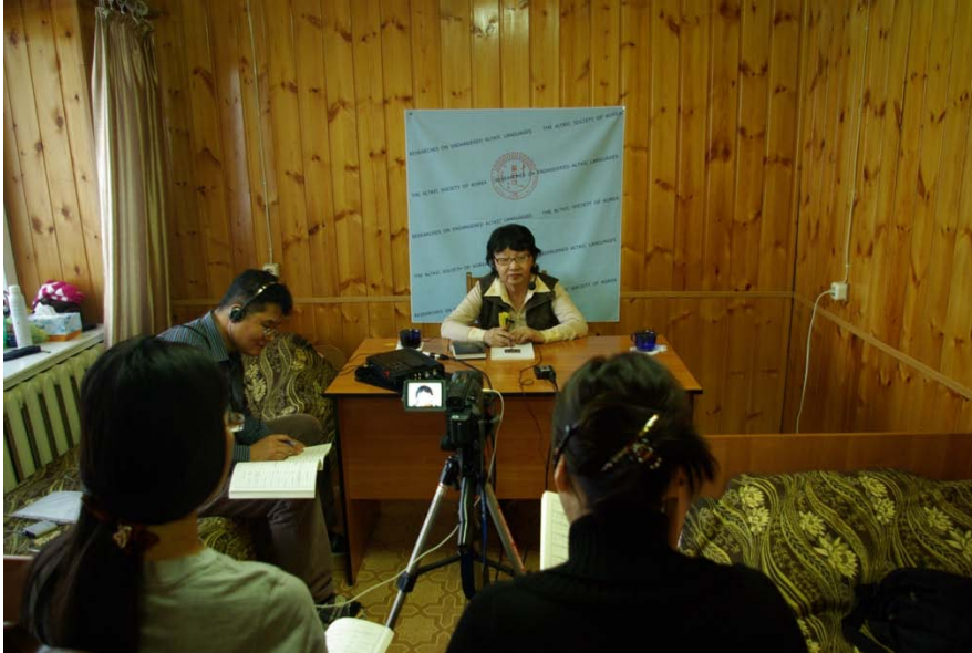
30.01.2007 (Yakutsk -Dolganca)