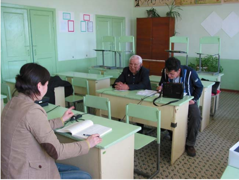
19.05.2006 (Tomsk - Aşağı Çulımca)