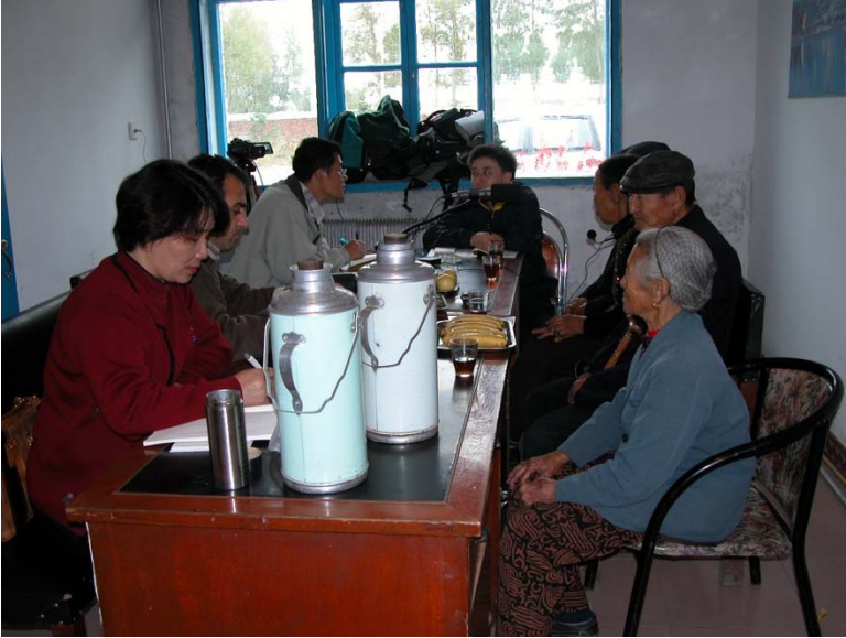
23.09.2003 Wujiazi ve Qijiazi, Mançurya / Çin (Fuyu Kırgızcası)