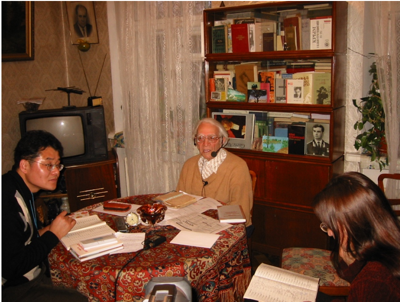
12.02.2006 (Simferopol - Kırımçakça)