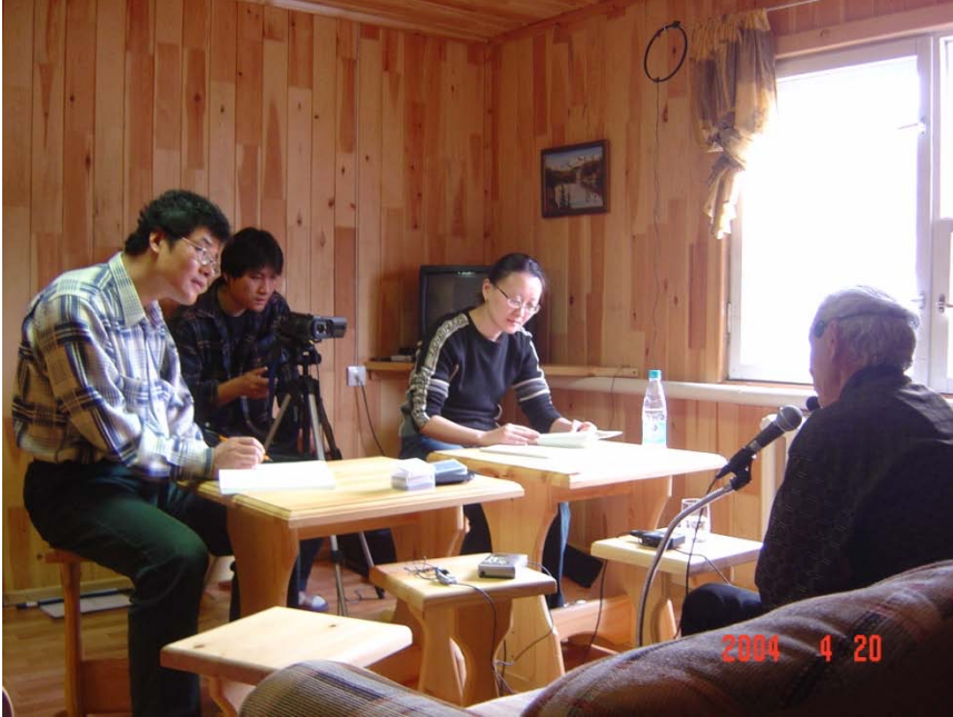
20.04.2004 (Tomazak (= Myski) - Şorca (Mrass diyalekti))