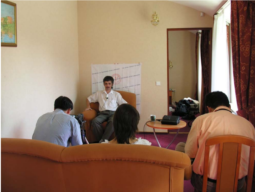
22.08.2007 (Ufa - Çuvaşça)