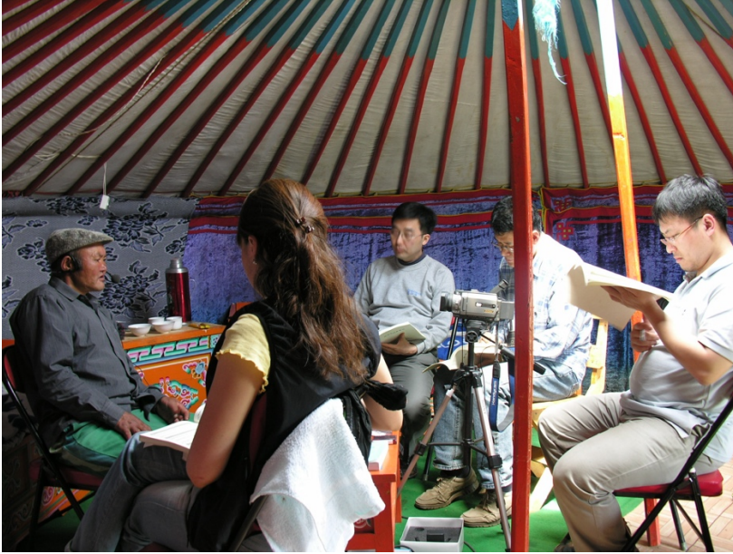
25.06.2005 (Alag-Erdene - Tuvaca Duha diyalekti)