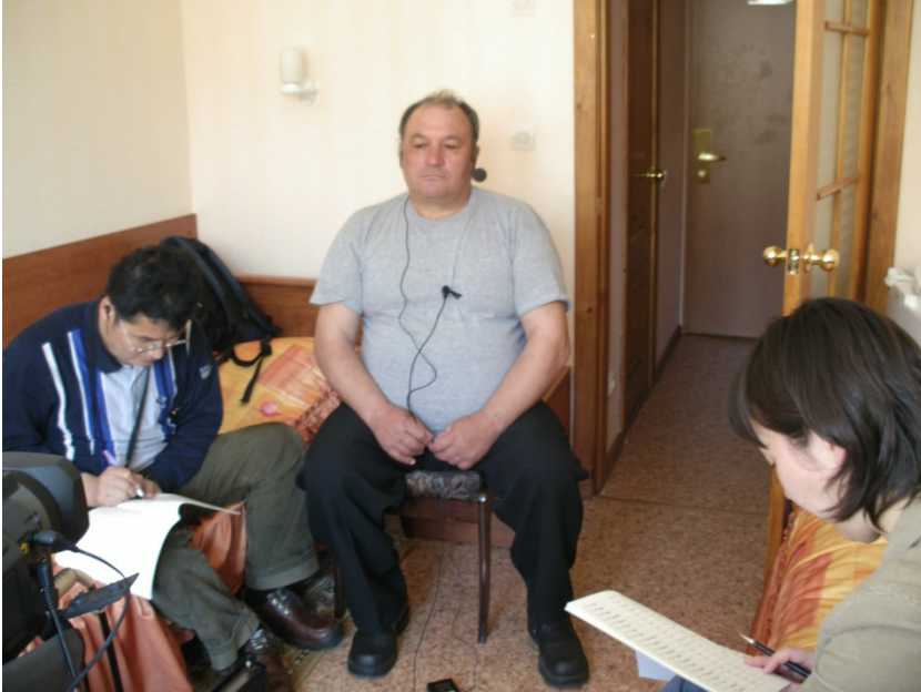
15.05.2006 (Tomsk - Orta Çulımca)