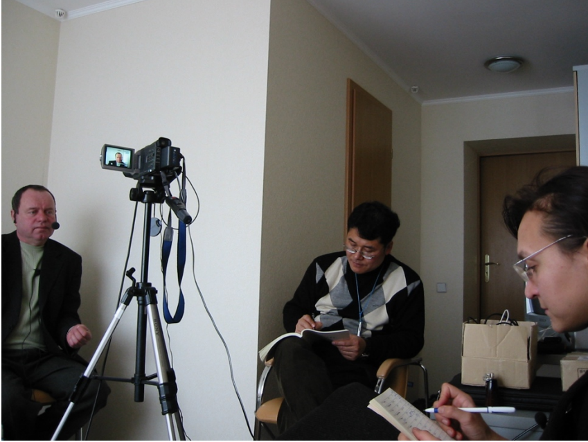
10.02.2006 (Mariupol - Urumca Oğuz diyalekti)