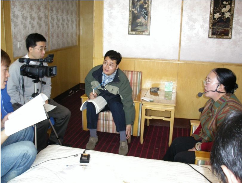
21.10.2005 (Hongwansi - Sarı Uyurca)