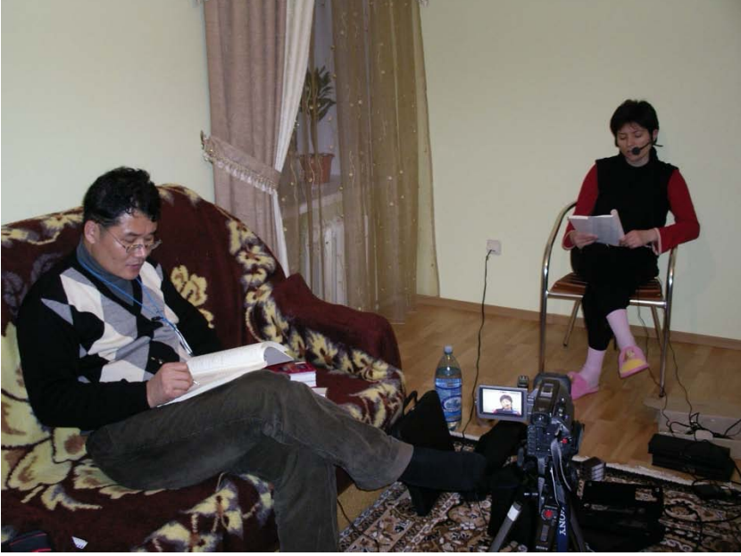
06.02.2006 (Kiyev - Gagauzca)