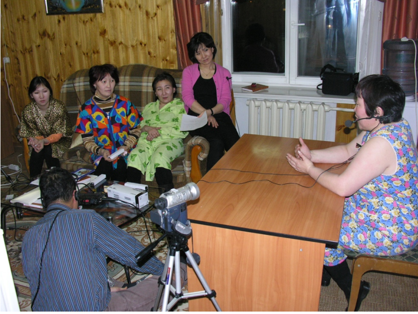
03.02.2007 (Yakutsk - Yakutça)