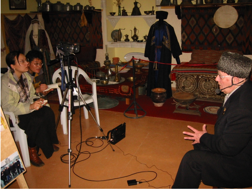
15.02.2006 (Simferopol - Karayca)