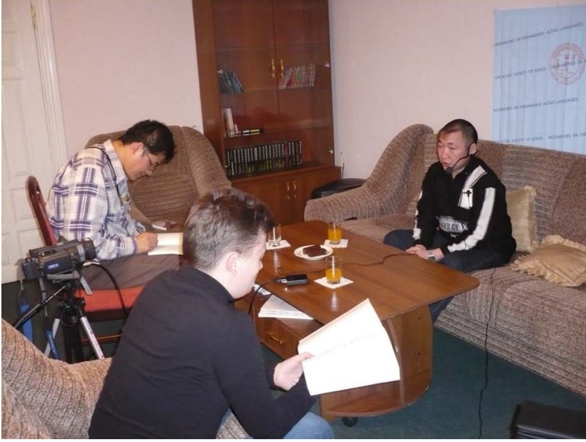
27.01.2009 (Gorno-Altaysk - Altayca)