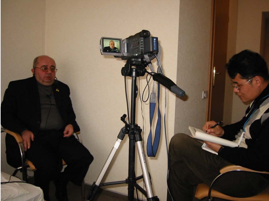
09.02.2006 (Mariupol - Urumca Kıpçak diyalekti)