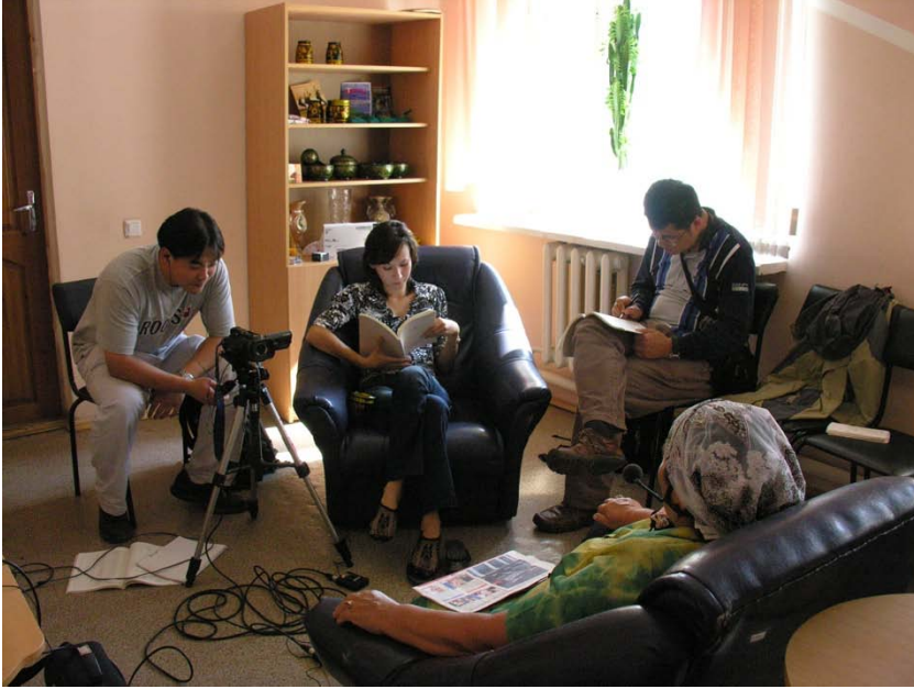
16.08.2007 (Rayevka - Başkurtça)