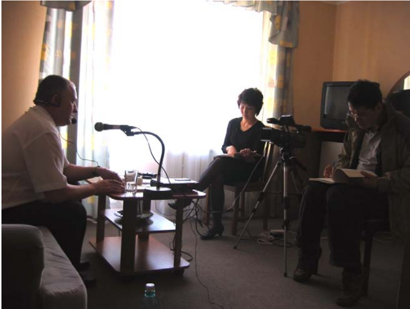
19.04.2005 (Çeboksarı - Çuvaşça)