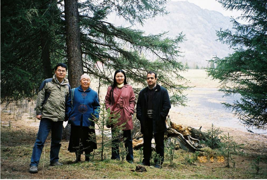
28.04.2005 (Kanas - Tuvaca Cungar Tuva diyalekti)