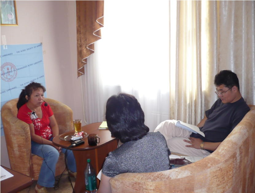
15.08.2008 (Abakan - Hakasça)