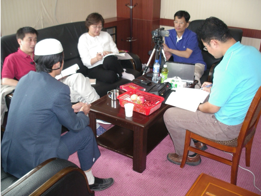
23.08.2006 (Xining - Salırca)