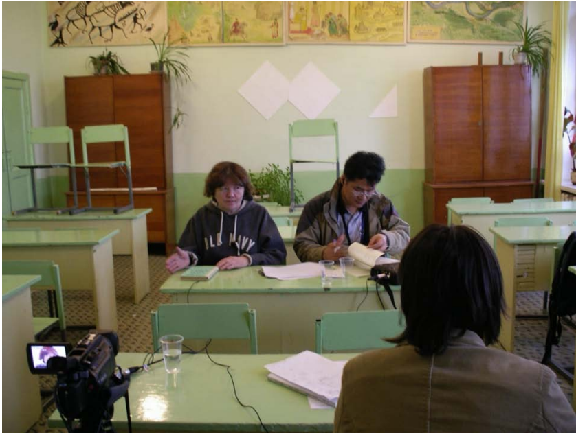
20.05.2006 (Tomsk - Sibirya Tatarcası)