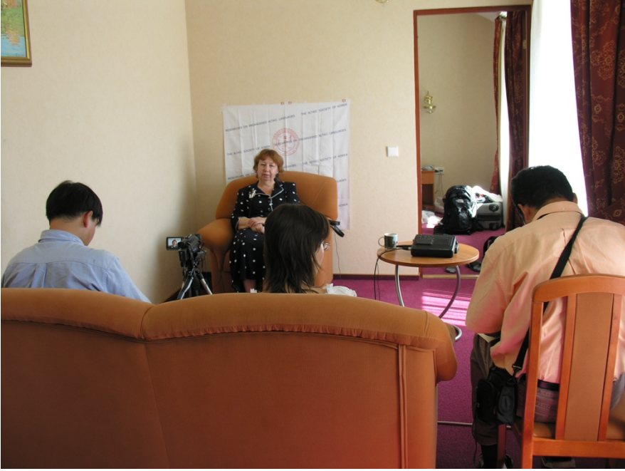
22.08.2007 (Ufa - Tatarca)