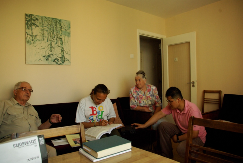
17.07.2007 (Trakai - Karayca)