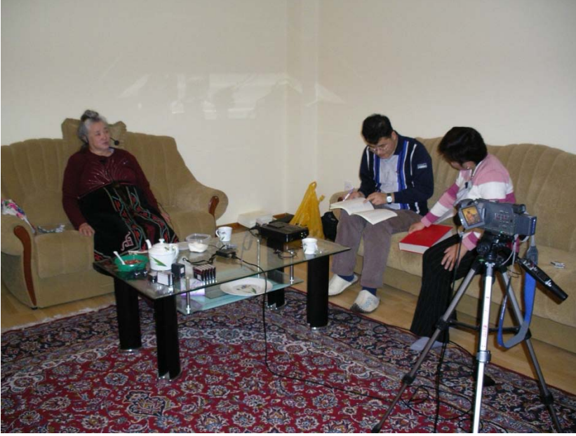
25.12.2006 (Bişkek - Kırgızca)