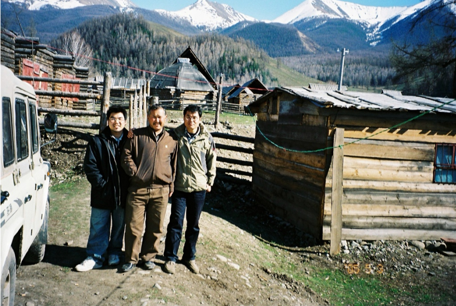
03.05.2005 (Ak-haba - Tuvaca Cungar Tuva diyalekti)