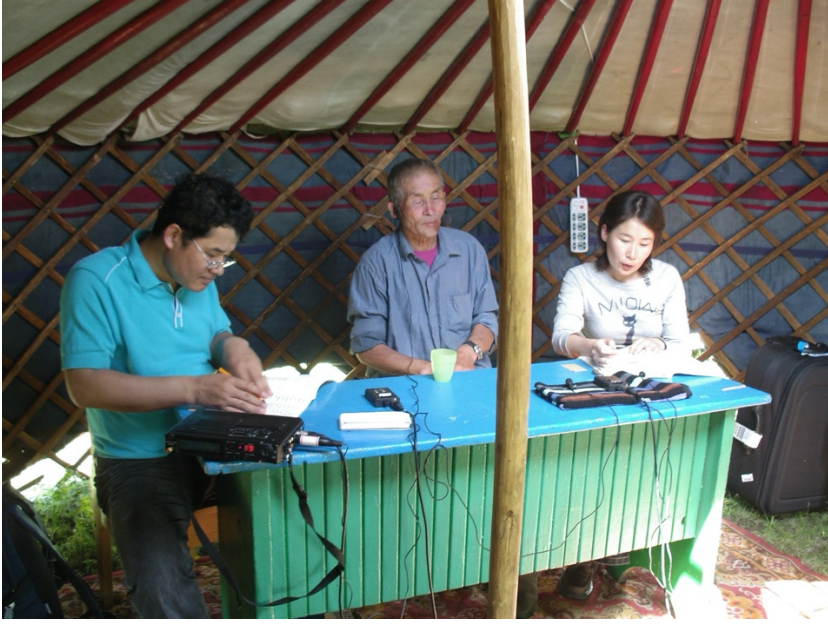
03.07.2006 (Tsagaan Üür - Tuvaca Uryanghay diyalekti)